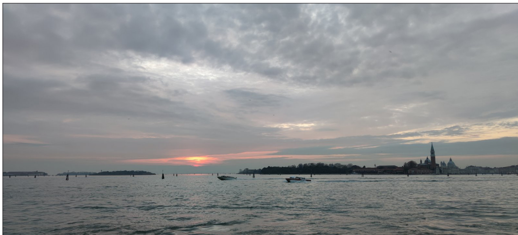
Обр. 6. Остров Сан Джорджо Маджоре, Венеция

Лабиринтът на Борхес е разположен в непосредствена близост до някогашни манастирски сгради, проектирани от великия архитект Андреа Паладио на остров Сан Джорджо Маджоре.