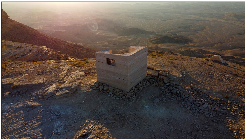
Обр. 12. Павилион за наблюдение Landroom , Gitai Architects

https://www.archdaily.com/946160/landroom-observatory-pavilion-gitai-architects Accessed 29 Oct 2021.