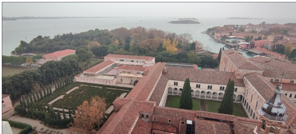
Обр. 11. Поглед към Лабиринта на Борхес от камбанарията на църквата Сан Джорджо Маджоре.

Този лабиринт е от типа, наречен на английски maze , тоест на моменти имаш право на избор, но ако поемеш по грешна пътека, трябва да се върнеш, за да тръгнеш по вярната и отвеждаща те на изхода – метафора на живота и неговата предопределеност.