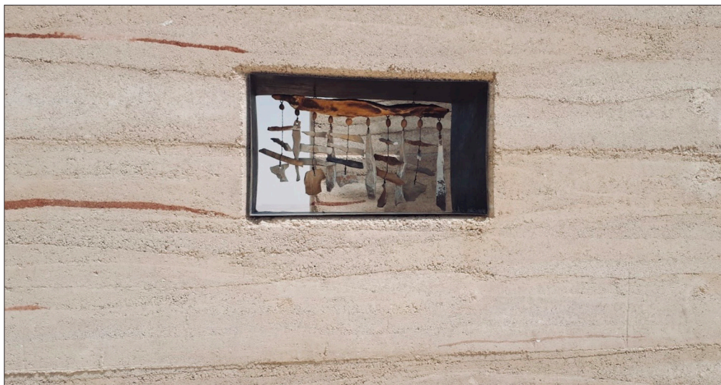
Обр. 13. „Камбанарията“ на Landroom, “Landroom Observatory Pavilion / Gitai Architects” 21 Aug 2020. ArchDaily. Accessed 29 Oct 2021. < https://www.archdaily.com/946160/landroom-observatory-pavilion-gitai-architects > ISSN 0719-8884

Спецификата на пустинния климат дават на този павилион и функцията на „убежище“ от жарките лъчи на слънцето през деня 12 .