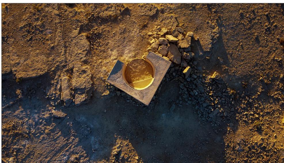
Обр. 14. Павилион за наблюдение Landroom, Gitai Architects https://www.archdaily.com/946160/landroom-observatory-pavilion-gitai-architects Accessed 29 Oct 2021. ISSN 0719-8884

Спецификата на пустинния климат дават на този павилион и функцията на „убежище“ от жарките лъчи на слънцето през деня 12 .