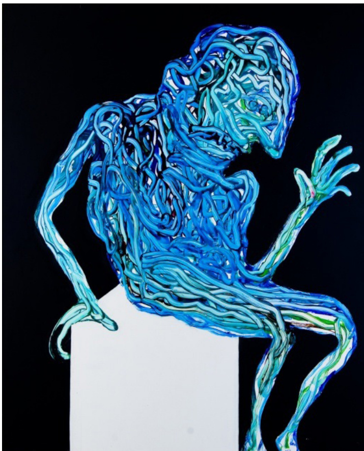
6. „Старец“, 2012 г., смесена техника на фазер, 92/115 см., автор: Петър Йедличка