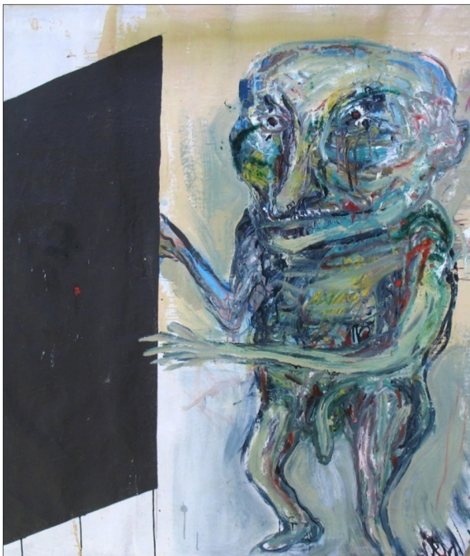
5. „Тринадесетата стая“, 2010 г., 122/148 см., смесена техника на платно, Музей на град Бърно, автор: Петр Йедличка