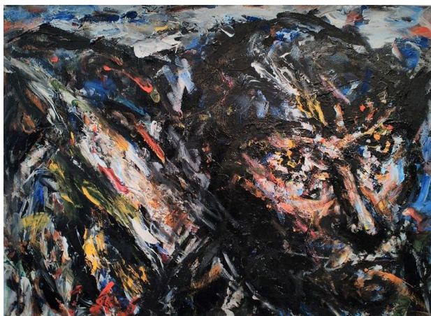
3. „Автопортрет“, 2016г., 60/40 см., м.б. платно, автор: Н. Русчуклиев