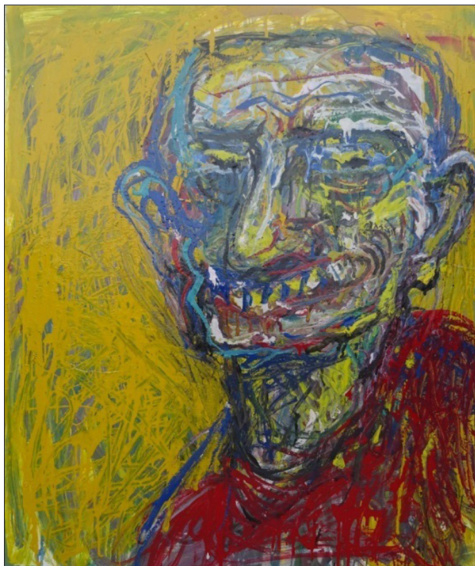
7. „Глава“, 2017г., 95/115 см., смесена техника на фазер, автор: Петър Йедличка