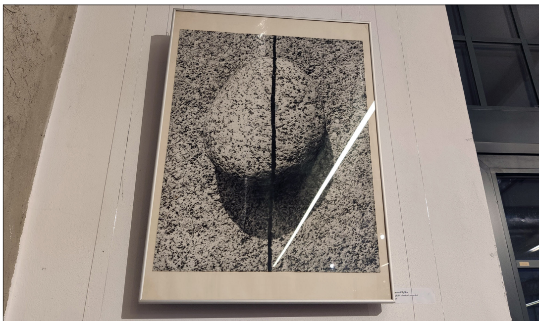
2. Zygmunt Rytko. Continual infinity (Зигмунт Ритка. Непрекъсната безкрайност)