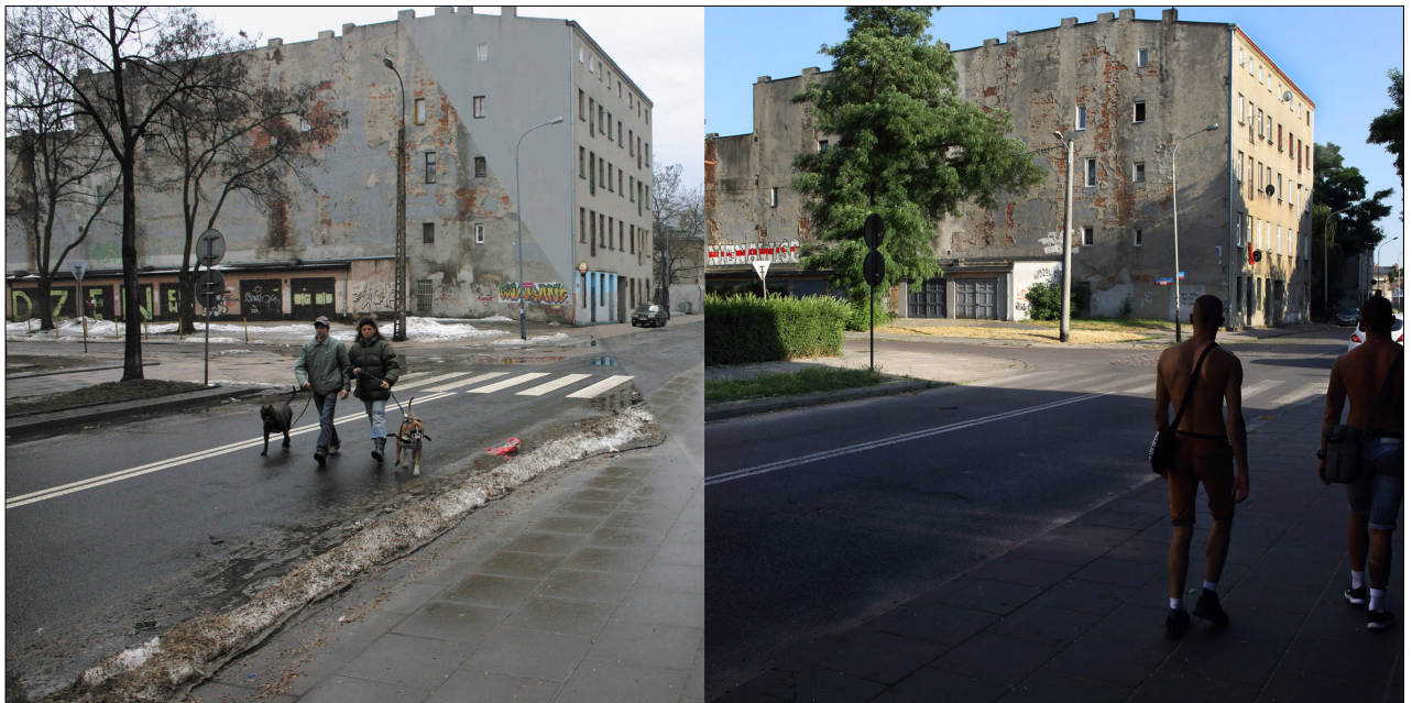
4. Artur Chrzanowski. Hatred (Артур Хиановски. Ненавист)