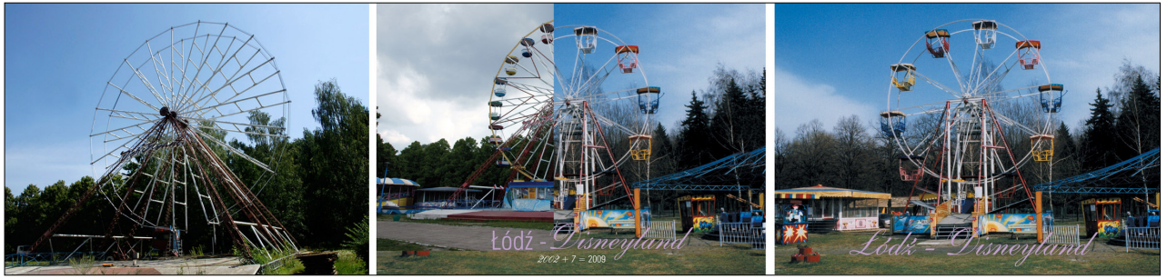
3. Artur Chrzanowski. Postcards (Артур Хиановски. Пощенска картичка)