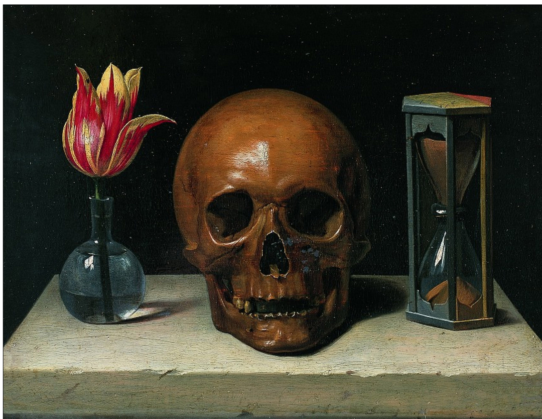
1. Philippe de Champaigne. Still Life with a Skull (Филип де Шампейн. Натюрморт с череп)

Приложение към: Артур Хриановски. „Времето“ като аспект в творбата (избрани примери на творби от полски концептуални художници, собствени и студентски творби) Supplements to: Artur Chrzanowski. The Aspect of “Time” in an Artistic Work (on Selected Examples of Polish Conceptual Art, Own Work and Student Works)