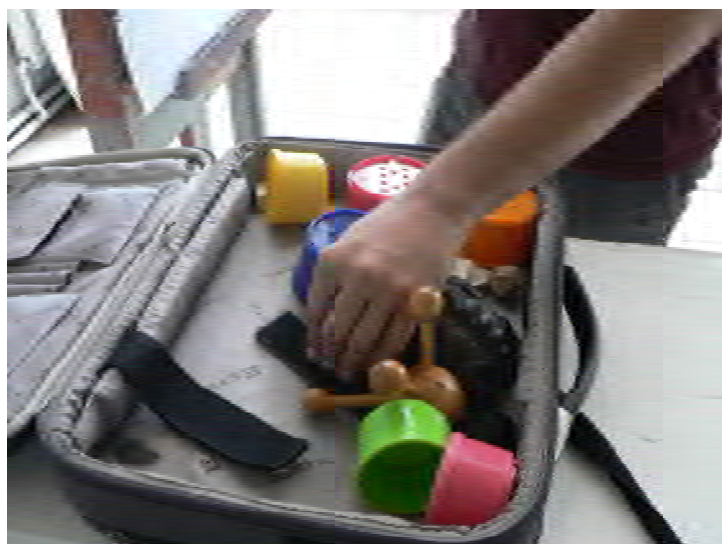
Снимка 6: Непосредствено преди акта на рисуване участниците в експерименталното студио докосват различни предмети, които са съобразени с размерите на човешката длан