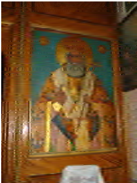
4. Иконата на „Св. Атанасий“ в южния край на иконостаса