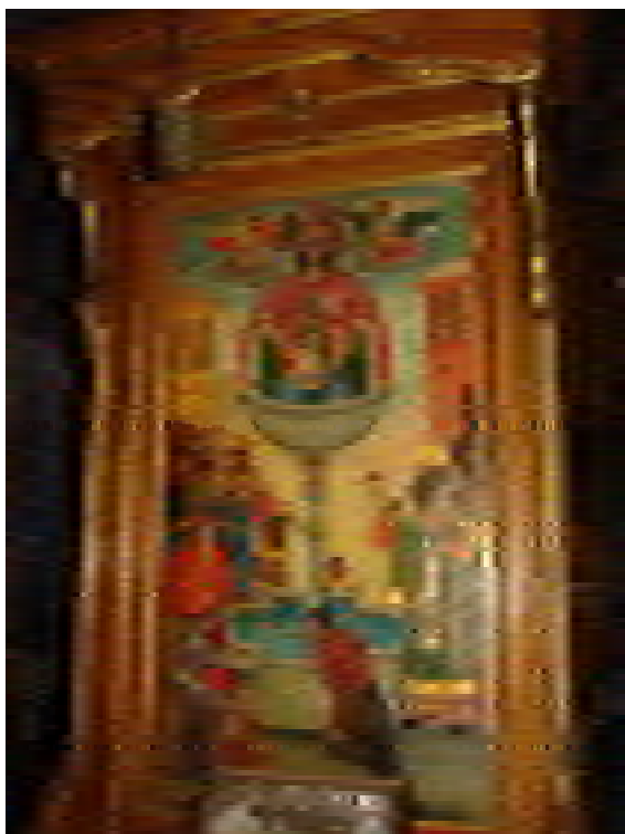
5. Иконата „Св. Богородица Живоносен източник“ от северния проскинетарий