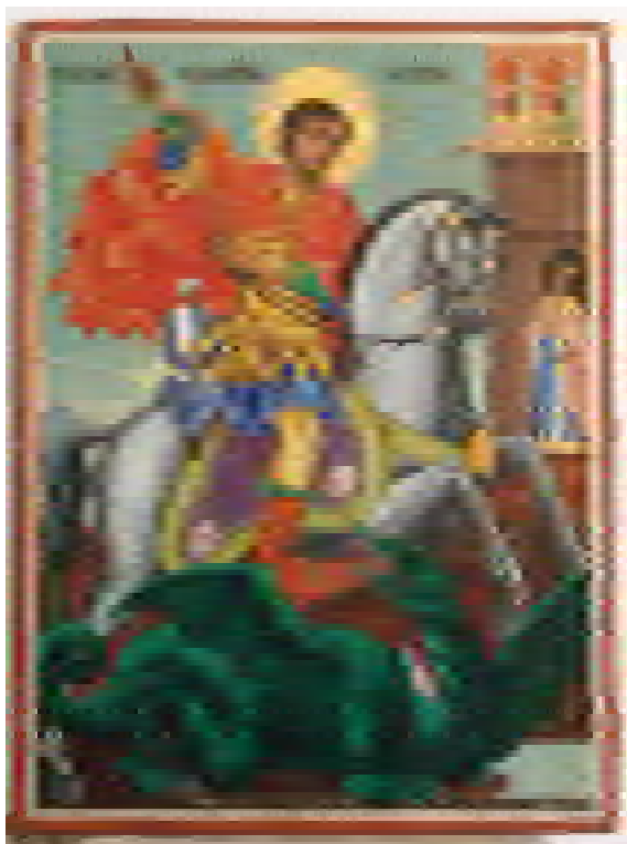
8. Иконата „Св. Георги“ след реставрация