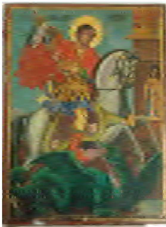
6. Иконата „Св. Георги“ преди реставрация