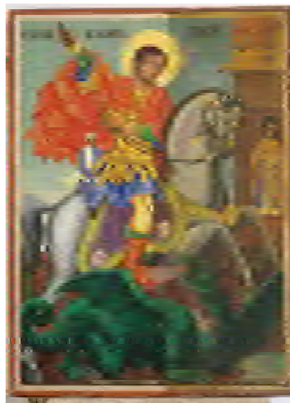
7. Иконата „Св. Георги“ по време на реставрация. Етап на работа, отстраняване на надживописванията и старото лаково покритие