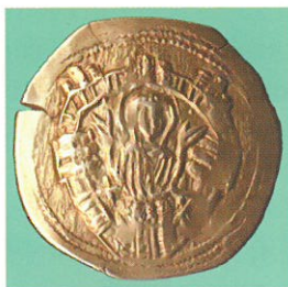
Обр. 6. Златна перпера на Михаил VIII Палеолог, Трето златно монетосечене, Константинопол.