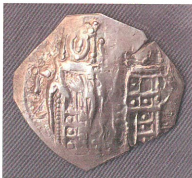
Обр. 10. Златна перпера на Андроник III Палеолог с Йоан V Палеолог и Ана Савойска, Константинопол.