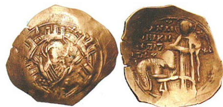
Обр. 7. Златна перпера на Андроник II Палеолог (сам) (1282—1295), Константинопол