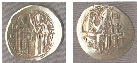
Обр. 4. Златна перпера на Михаил VIII Палеолог, Първо златно монетосечене, Магнезия.