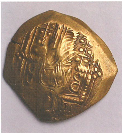
Обр. 5. Златна перпера на Михаил VIII Палеолог, Второ златно монетосечене, Константинопол.