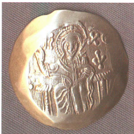
Обр. 3. Златна перпера на Йоан III Дука Ватаци (1222—1254), Магнезия