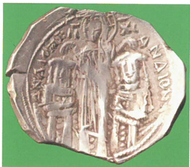
Обр. 9. Златна перпера на Андроник II с Андроник III Палеолог (1325—1328), Константинопол.