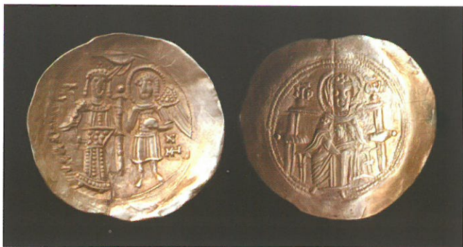
Обр. 2. Златна перпера на Исак II Ангел (1185—1195), Константинопол