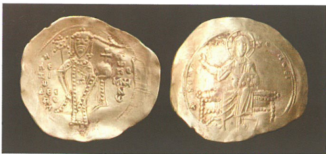
Обр. 1. Златна перпера на Алексий I Комнин (1081—1118), Константинопол