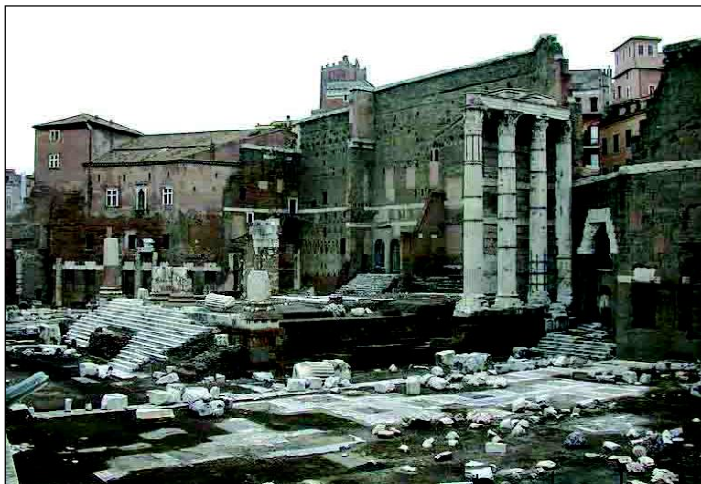
Изобр. 1. Съвременен изглед към храма на Mars Ultor