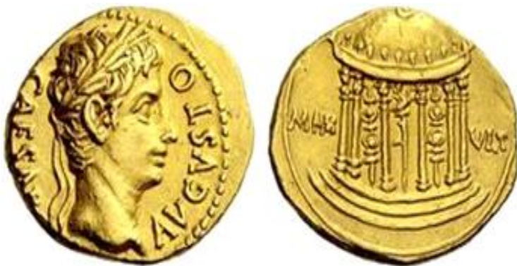
Изобр. 3. Ауреус, ок 18 г.пр.Хр. Ав. Август с лавров венец и надпис CAESAR AVGVSTO ; реверс. хексастилен кръгъл храм с aquila и две знамена, придружен от надпис MAR VLT. RIC I, 104