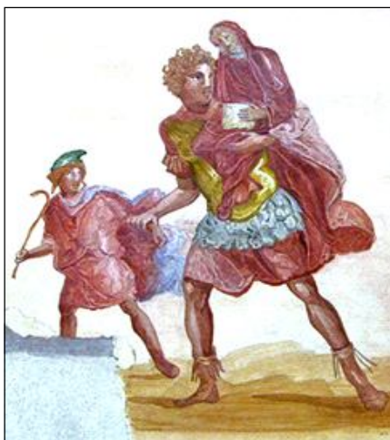
Изобр. 8 и 9. Еней, който отнася баща си на гръб от Троя, държейки малкия Iulus за ръка, и Ромул, който носи оръжието на победения от него в лична схватка противников предводител (наричана spolia optima – или най-великата плячка). Копия на фрески от Помпей. Fig. 156a и fig. 156b по Zanker 1988