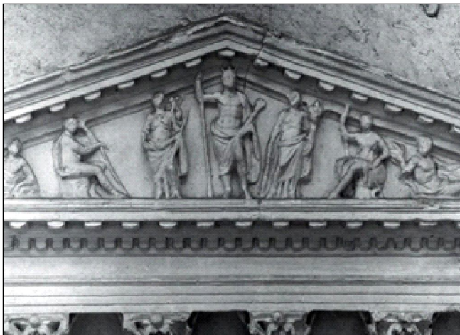
Изобр. 7. Фронтонът на храма на Mars. Fig. 150 по Zanker 1988. Детайл от релеф от времето на Клавдий, fig. 86 по Zanker 1988