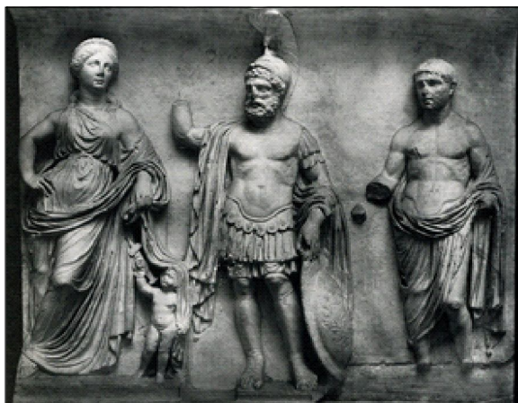
Изобр. 6. Релеф на Венера, Ерос, Марс и Divus Iulius . Алжир, Musée Nationales d'Antiquites . Fig. 151 no Zanker 1988