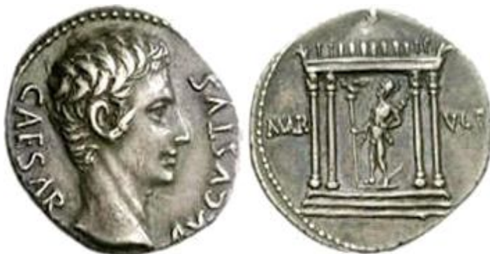
Изобр. 4. Денарий, ок 19 г.пр.Хр. Ав. Август с надпис CAESAR AVGVSTO ; реверс. тетрастилен храм със статуя на Марс, придружен с надпис MAR VLT. RIC I, 69a