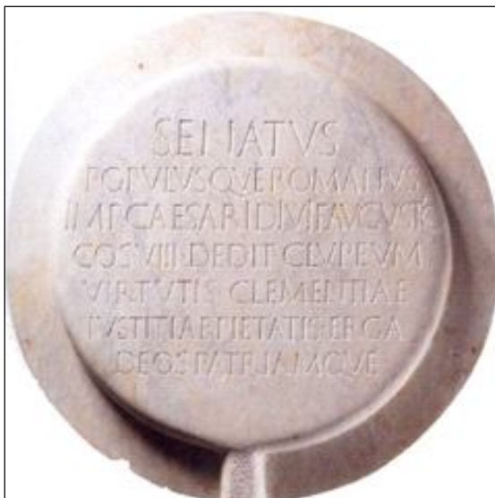
Изобр. 10. Clipeus virtutis . Най-добре запазеното копие днес се намира в Musue Lapidaire в Арл. Fig 79 по Zanker 1988