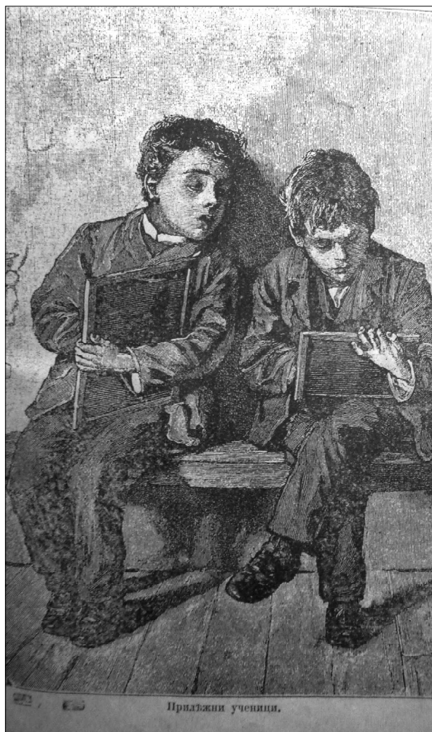
4. Илюстрация, год. II, VII, стр. 114