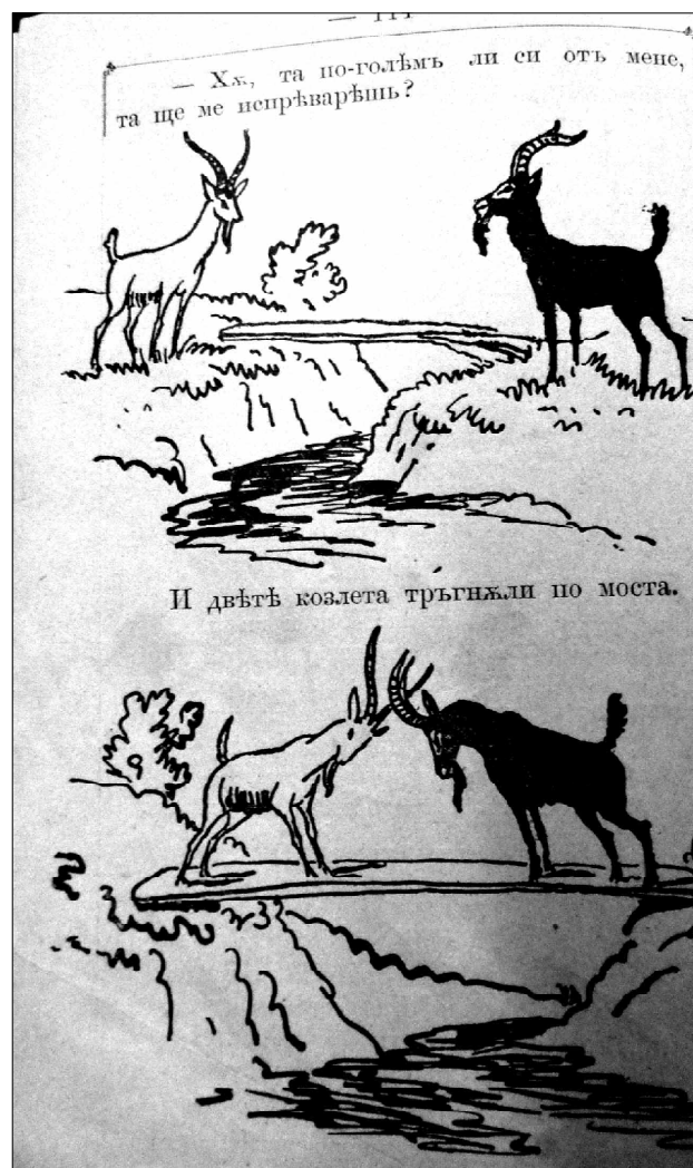
3. Илюстрация, год. II, кн. I, стр. 1