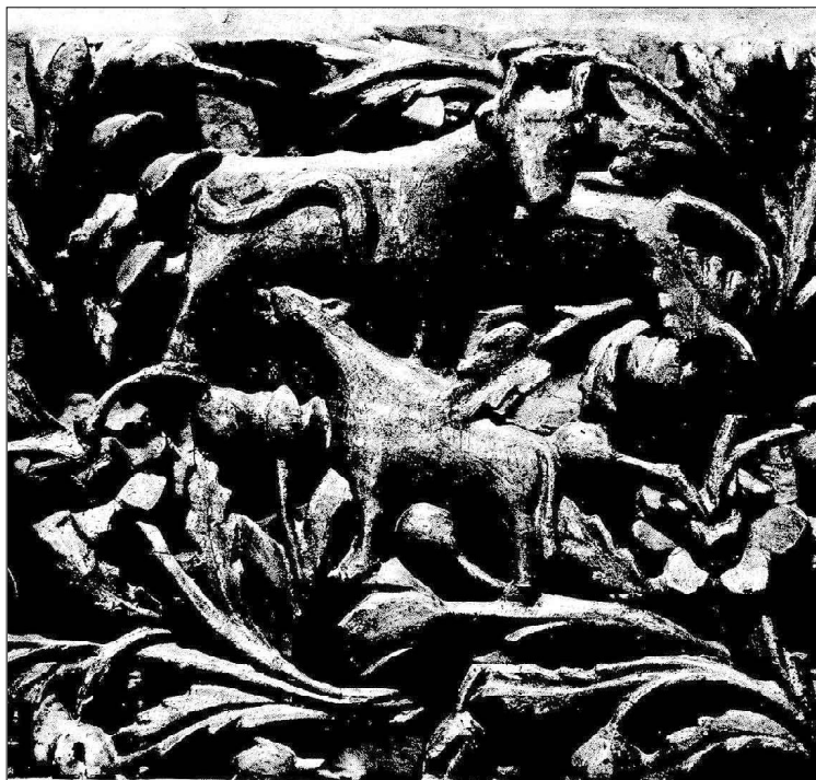
9. Тешево, Благоевградско. Мотив от малка табла: Теле бозае