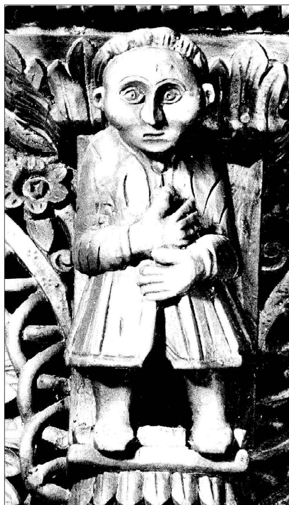
10. Етрополе. Храм „Св. Архангел“. Светска фигура на дарител от иконостаса