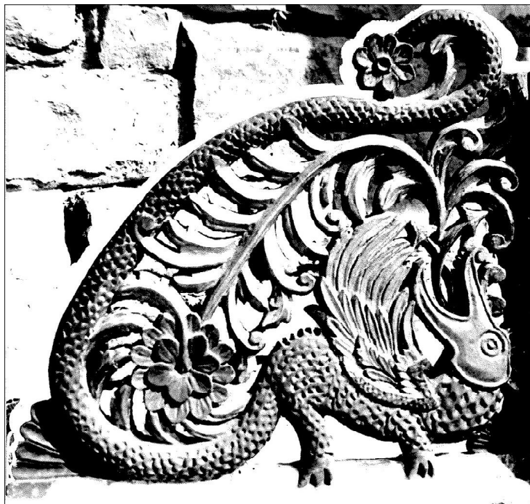
2. Каломан, Габровско. Двери (детайл). Ламя с опашка от цветна розета, символ на растителността и пазител на царския вход от иконостаса