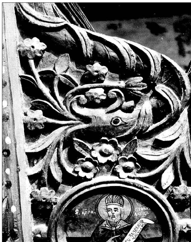
1. Станке Лисичково, Благоевградско. Двери (детайл). Ламя изхвърля из пастта си растителни клонки и цветя