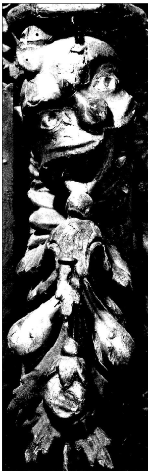
8. Горни Воден, Асеновградско. Иконостасен пиластър. Гротескова глава със символи на плодородието