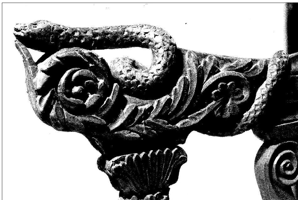
5. Севлиево. Храм „Св. прор. Илия“. Подръчниците на владическия трон със змии пазители