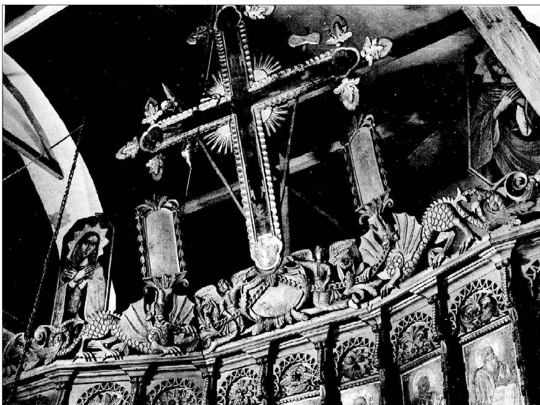
3. Берковица. Храм „Св. Николай“. Венчилка. Разпятието се пази от две лами, подпомагани от два архангела