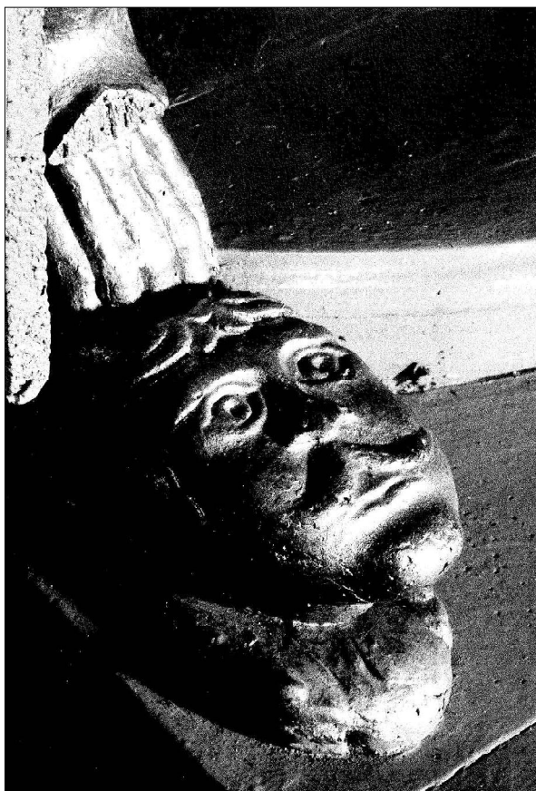
7. Дупница. Храм „Покров Богородичен“. Глава пазител на владическия трон