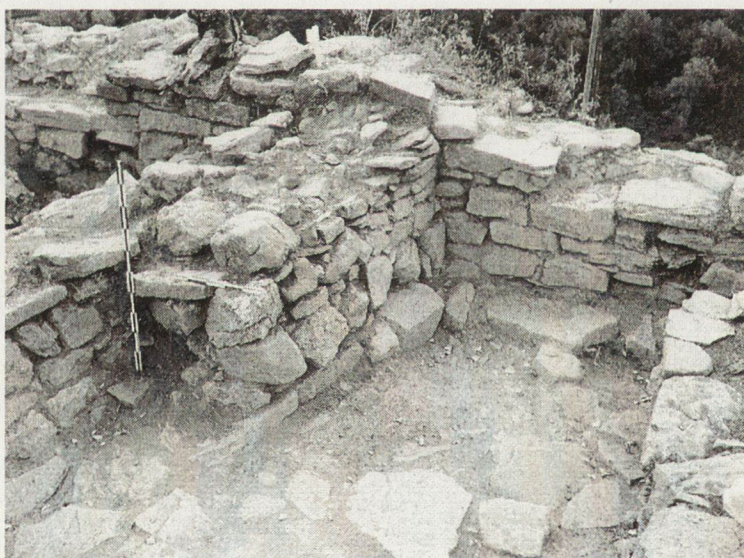
Обр. 2. Стълбище към бойната платформа на крепостната стена