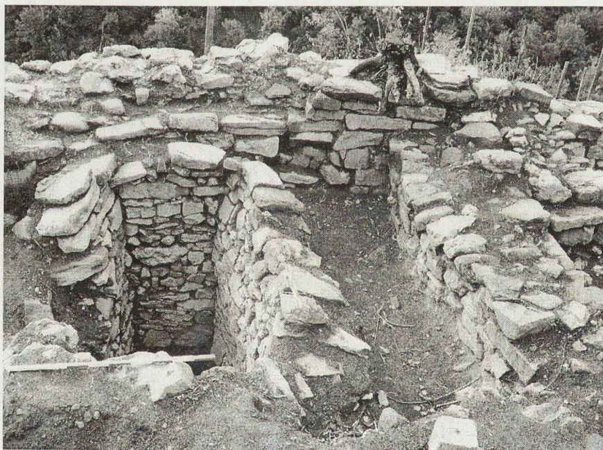
Обр. 6. Хранилище за военновременни запаси