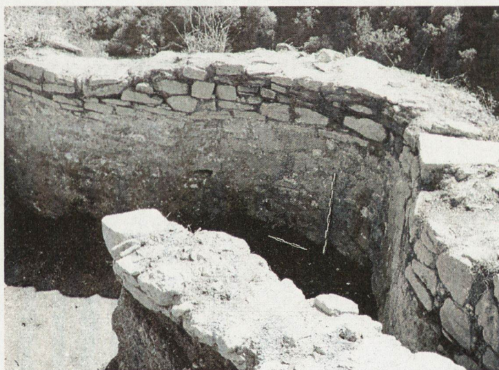
Обр. 4. Вътрешна страна на кулата.