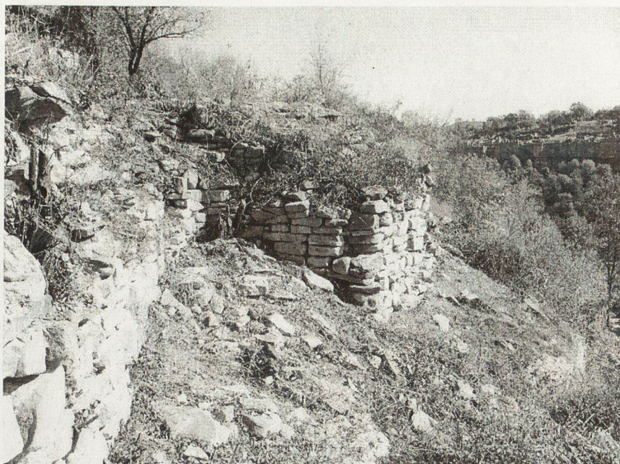
Обр. 5. Външна страна на кулата