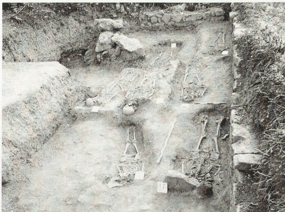
Обр. 7. Християнски гробове по протежение на вътрешното лице на крепостната стена.