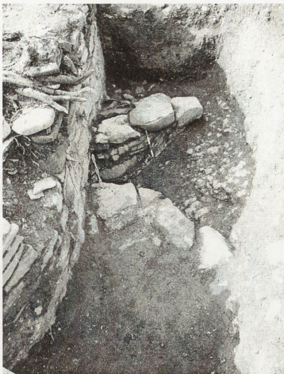
Обр. 3. Отводнително съоръжение в крепостната стена, южно от църква 014.