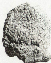
Обр. 1. Пломба на Ареобинд, епарх и комеркиарий.