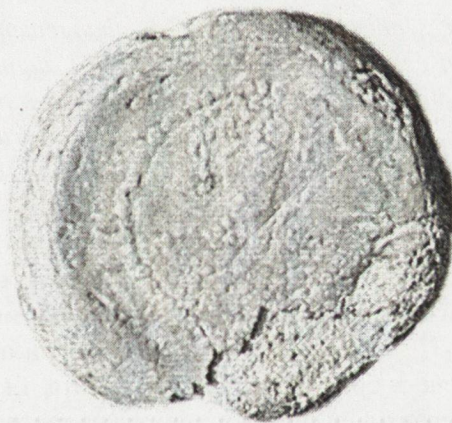
Обр. 3. Анонимен печат от X в. (по Тотев, К. Неизвестен анонимен печат , с. 187).