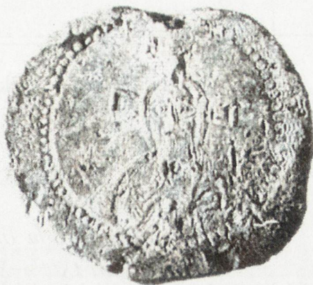
Обр. 2. Анонимен печат на български владетел от втората половина на IX в. (по Йорданов, И. Корпус , № 40.)