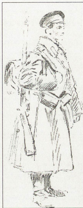
Илюстрации от Балканските войни на Ж. Скот – български войници в пълно бойно снаряжение 1913 г., колекция НВИМ

Заповед № 77 от 1906 г. отменя мундирите за войниците в цялата българска армия с изключение на шевските полкове. Тази промяна цели икономия на средства от войнишко облекло. Въвежда се като основно облекло в армията шаячната куртка. Вместо калпак се носи фуражка с кожена козирка. Яката и обшлагите през 1906 г. стават червени. При пехотата, артилерията, кавалерията и пионерните части пагоните са червени с № на полка от щампована боя. Панталонът е тъмно син с червен кант, при полеви занятия се използва шаечен с цвета на куртката. Шинелът е двуборден с 6 копчета по средата, обърната яка с петлици, обърнати маншети и коланче за пристягане отзад.