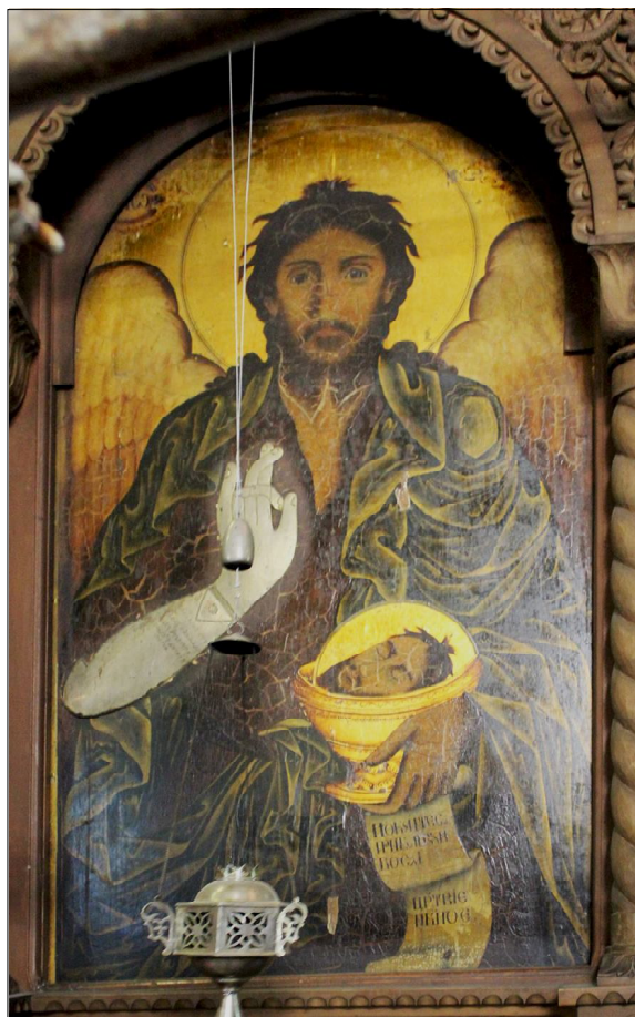
Фиг. 5. „Св. Йоан Кръстител”, вероятно Васил Беделев, темпера/дърво, 150 x 80 см, вероятно 1857–1858 г., храм „Успение Пресветия Богородици”, Търговище

По отношение на иконата „Св. Богородица с Младенеца” (149 x 85 см), (Фиг. 4.), проф. Любен Прашков отбелязва, че е използван рядко срещан иконописен сюжет, изпълнен със сериозно майсторство – тя е изобразена като Царица Небесна и Младенецът, също облечен в царска одежда, не седи в скута ѝ, а е стъпил изправен, докато в горната част на иконата са изобразени полуфигурите на двама