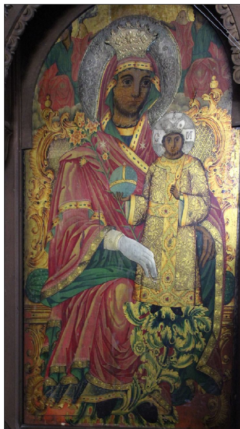
Фиг. 4. „Пресвета Богородица с Младенеца“, вероятно Васил Беделев, темпера/дърво, 149 x 85 см, вероятно 1857–1858 г., храм „Успение Пресветия Богородици“, Търговище

Към оцелелите до наши дни общо четири подписани заедно или поотделно икони на Беделев и Василев – „Св. Николай с житие“ от 27 март 1857 г. (Фиг. 1.), „Св. Георги и св. Димитър“ от 12 юни 1858 г. на Василев (Фиг. 3.), „Св. Теодор Тирон“ от 20 август 1858 г. на Василев и „Св. Атанасий“ на Беделев от 1858 г., без никакво съмнение трябва да се добавят останалите пет, чиито характеристики еднозначно показват почерка на шуменските зографи – „Христос Велик Архидякон“, „Св. Богородица с Младенеца“, „Св. Йоан Кръстител“, „Св. Василий Велики“ и „Св. арх. Михаил“, въпреки липсата на запазени подписи и дати. Техните размери, стил, композиционно и живописно изграждане, категорично говорят за авторството на шуменци, на чието доказване е посветено настоящото изследване. Ако проф. Прашков е прав в извода си, че образът на св. Харалампий е по-късен от останалите, може да се предположи, че тази шеста икона на шуменци е рисувана по-късно, вероятно за заместване на изгоряла при пожара икона от царския ред на първия иконостас.