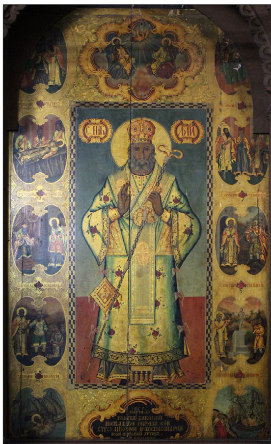
Фиг. 1. „Св. Николай с житие”, Васил Хр. Беделев, Никола Василев, темпера/дърво, 151 x 81 см., 1857 г., храм „Успение Пресветия Богородици”, Търговище

която поради неизвестни причини е останала извън полезрението на Асен Василиев. Изображението представя св. Николай Мирликийски Чудотворец с 10 сцени от житието му 12 и е увенчано с Новозаветна Св. Троица. Ктиторският надпис, изписан в голяма винетка, поставена централно в долната част на иконата (Фиг. 2), гласи: „1857. Марта. 27 Руфетъ бакалски посвѣщава образъ сей стго Николая душеспасения ради Рука Василяки Христувъ Никола Василюв”.