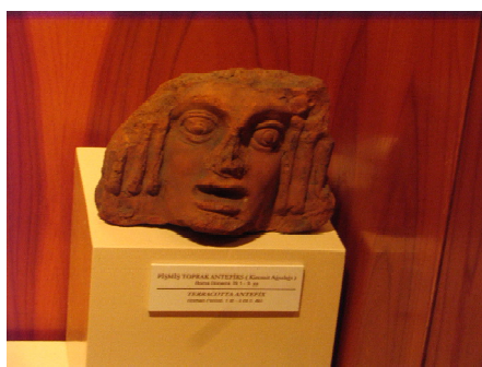
Обр. 2. Антефикс, експониран в Археологическия музей в Истанбул.