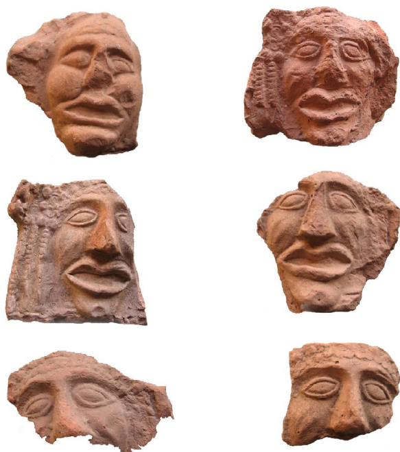
Обр. 4-9. Антефиси от римския лагер Нове