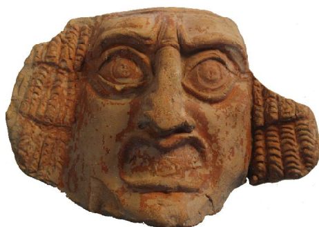
Обр. 1. Антефикс от производствения център при Павликени (западната част от територията на Никополис ад Иструм)