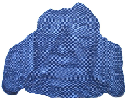
Обр. 3. Антефикс от с. Байкал, Плевенско.