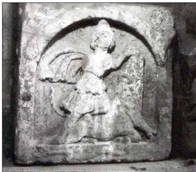
Обр. 1. Релеф на Митра от с. Гиген, Плевенско