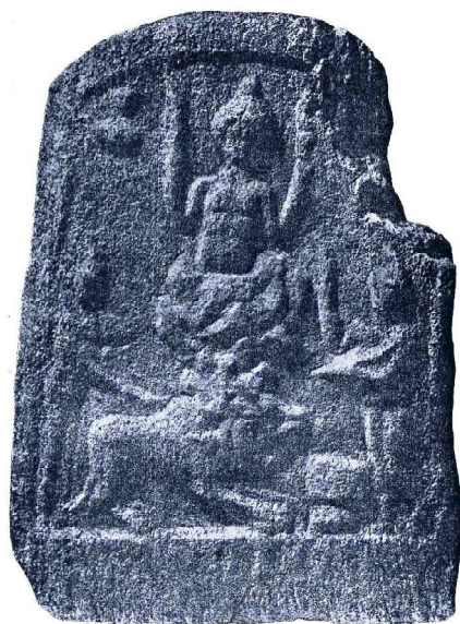
Обр. 10. Релеф на Митра ( petra genetrix ) от с. Ветрен, Пловдивско