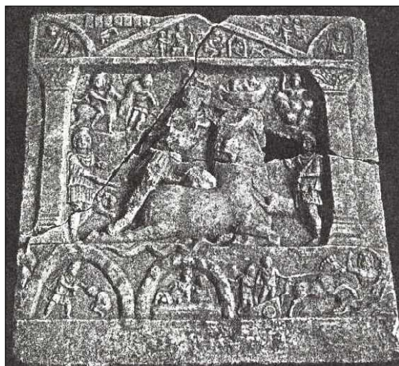
Обр. 6. Централен култов релеф на Митра от светилището край с. Таваличево, Кюстендилско