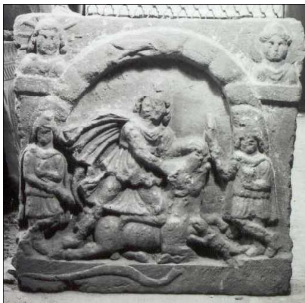
Обр. 4. Релеф на Митра от Плевен