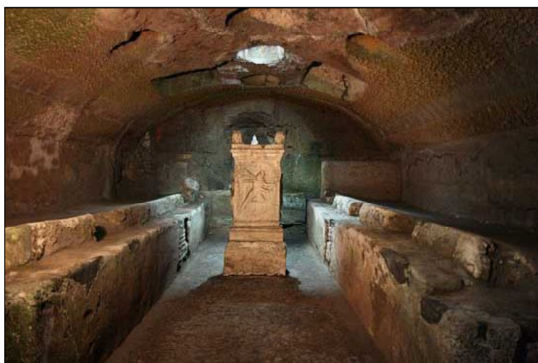
Обр. 8. Митреумът под базиликата Сан Клементе в Рим