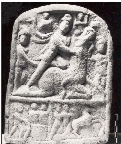
Обр. 7. Релеф на Митра с неизвестно местонамиране в Тракия