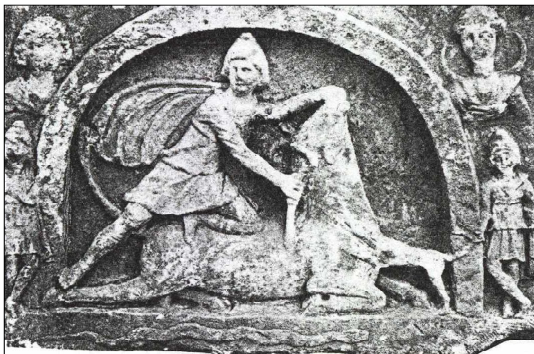
Обр. 3. Централен култов релеф на Митра от светилището край с. Крета, Плевенско