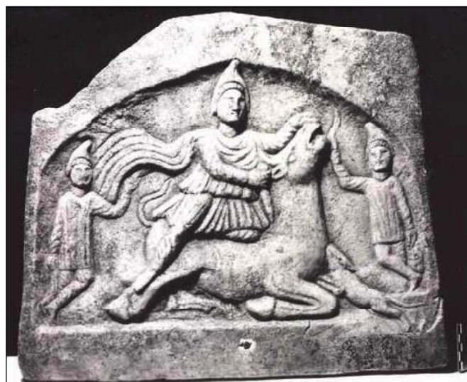
Обр. 2. Релеф на Митра от с. Гиген, Плевенско