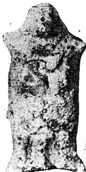
Обр. 2. Антропоморфната фигурка от гроб № 83 на некропола Орся (по Т. Филипов, 1978, обр. 3, с. 10).