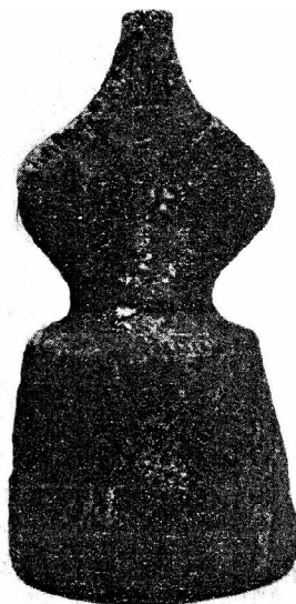
Обр. 3. Антропоморфната фигурка от гроб № 41 на некропола Орся (по А. Бонев, 2003, табл. 19, 22).