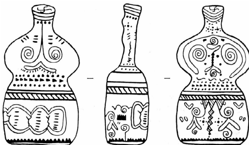
Обр. 4. Антропоморфните фигурки от гроб № 148 на некропола Орсоя (по Т. Филипов, 1978, обр. 8, с. 13).