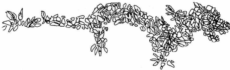
中华第一龙(仰韶文化时期)