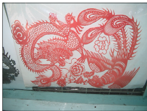
Обр. 5. Дракон и феникс, изрязани от червена хартия