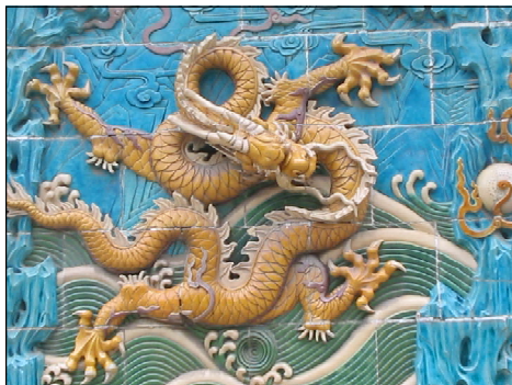
Обр. 4. Стената на деветте дракона в парка Бейхай, Пекин, един от драконите в по-близък план