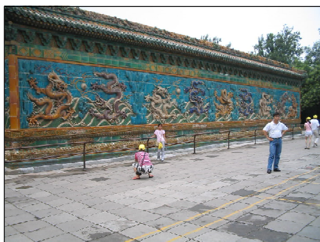
Обр. 3. Стената на деветте дракона в парка Бейхай, Пекин