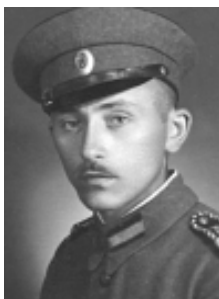
В Школата за запасни офицери в Търново (1943 г.)