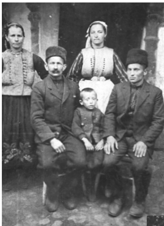
С родителите си – двамата вляво (1926 г.)