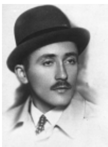
Студент в Софийския университет (1942 г.)