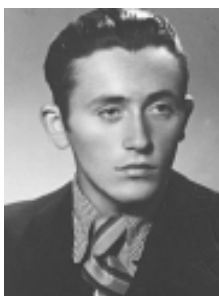
Студент в Софийския университет (1939 г.)