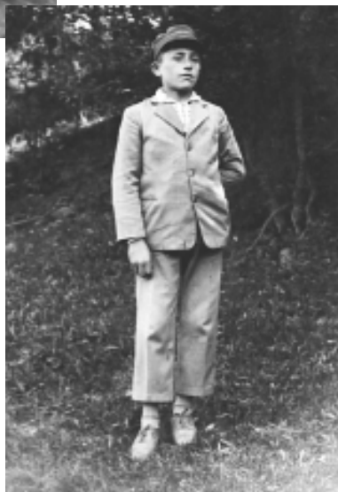
Ученик във Втори прогимназиален клас, с. Ново село (сега гр. Априлци), Троянско (1932 г.)