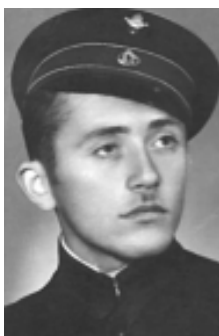
Ученик в Априловската гимназия, Габрово (1938 г.)