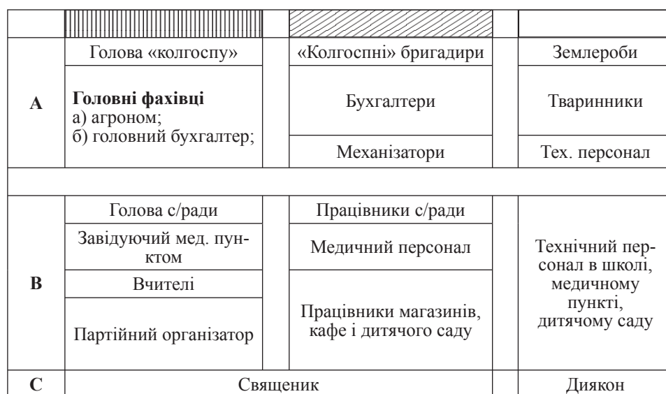
Схема 1. Структура суспільства в болгарських селах Південної України в другій половині XX століття

Значні зміни відбуваються зв'язку з організацією колгоспів в другій половині 1940-х рр. Їх господарсько-адміністративна організація і проникнення радянської системи створюють нову соціальну стратифікацію в болгарських селах. Введення обов'язкової освіти, відкритий доступ до середньо-спеціальних і вищих учбових закладів є важливою умовою диференціації населення за освітньою та професійною ознакою (див. сх. 1). Ці зміни приводять до формування нових структур і ієрархій в суспільстві, що впливає на болгарську сім'ю і, перш за все, на взаємодії між поколіннями в ній. Зміна поколінь, це потік, який гарантує передавання соціальної інформації, культури, досвіду від одного покоління до іншого 7 . Проблема спадкоємності і конфліктів у відносинах між батьками і дітьми може розглядатися як одна з особливостей передавання культурних цінностей від покоління до покоління. Зміни, що ігнорують досвід попередніх поколінь ведуть до виникнення конфліктів.