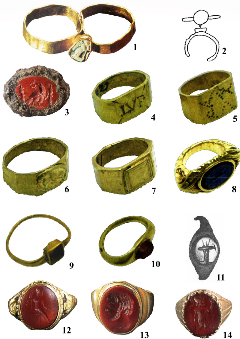
Обр. 3. Пръстени (1–3, 12–14 – Novae ; 4–11 – Durostorum )