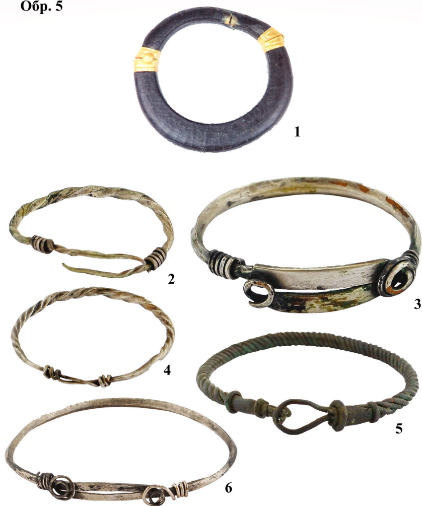
Обр. 5. Гривни (1. Durostorum ; 2–6. Novae )