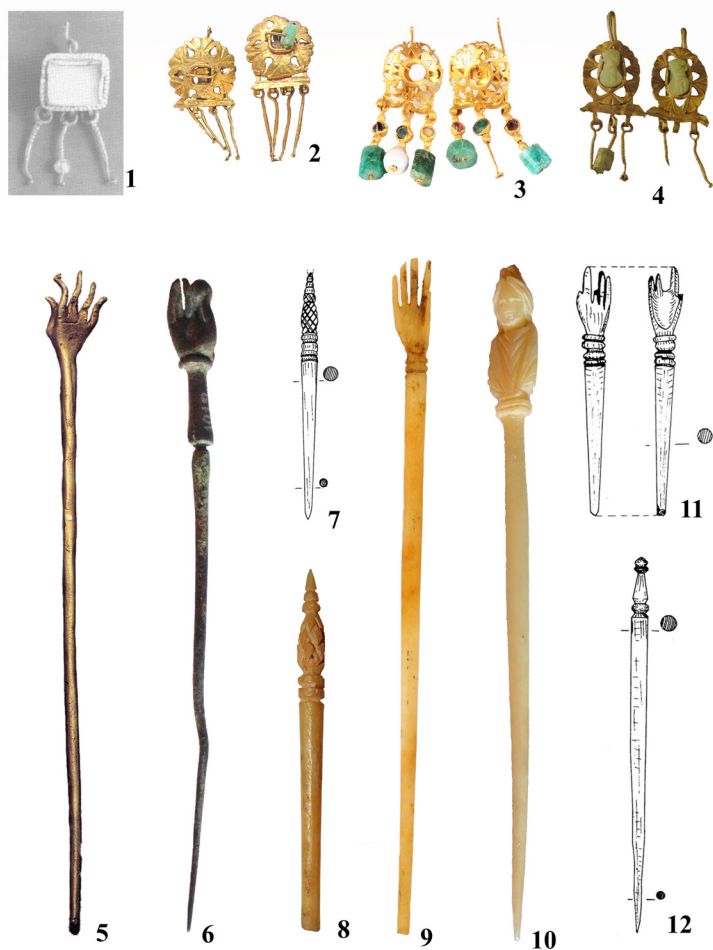
Обр. 1. Обеци и игли за коса (1–2, 5–6, 8–10 – Novae ; 3–4, 7, 11–12 – Durostorum )